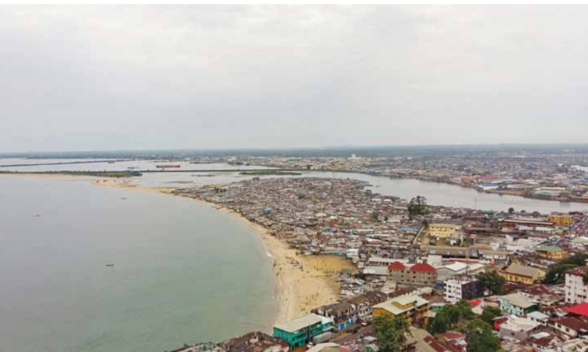
À gauche : Sidonia Gabriel, au Libéria pour l'AGEH.

monde sur place, car tout changement de rapport de force implique que des gens vont perdre du pouvoir. Il faut également avoir conscience que sa présence peut avoir un impact politique. Il est donc primordial de comprendre et insérer les affectations dans une perspective stratégique de sortie de fragilité. Finalement il est indispensable de les accompagner et les suivre durant leur affectation, car la gestion du contexte peut vite devenir une surcharge au niveau psychologique et sécuritaire.