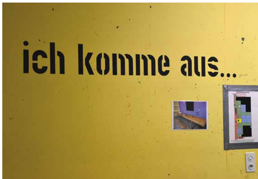
Asyl-Kollektivunterkunft in Bern.

Die Ausgaben der Schweiz für die öffentliche Entwicklungshilfe fallen nicht nur in wirtschaftlich schwachen Ländern an. Die Schweiz selbst ist auch Empfängerin ihrer Entwicklungsgelder.