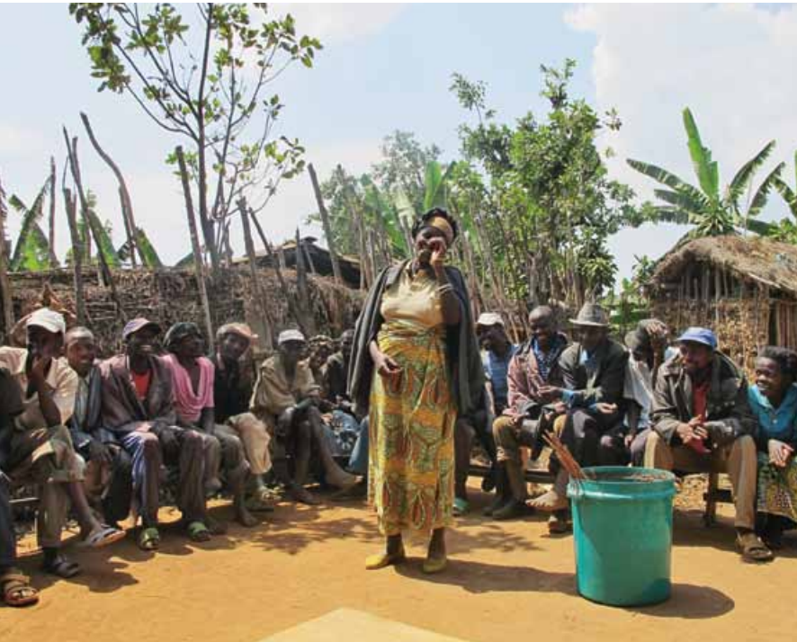
Sozialtherapie für Opfer des Genozids, Ruanda.