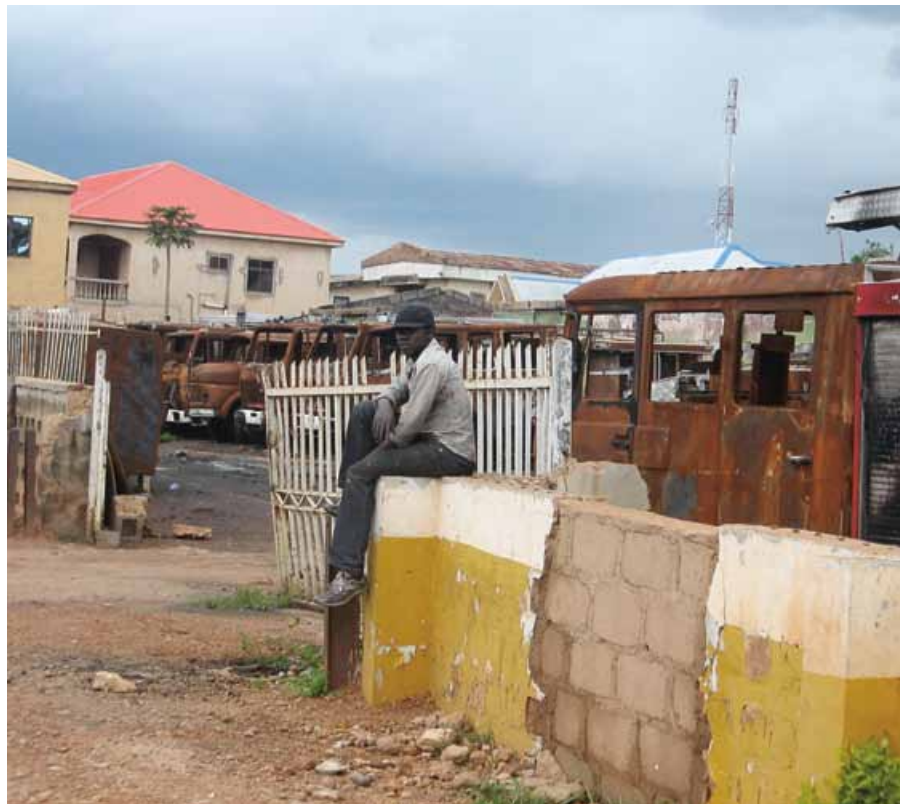
Stadt Jos in Nigeria nach gewaltsamen Unruhen.

Eine einheitliche Definition von fragilen Kontexten gibt es nicht. International ist anerkannt, dass Länder, in denen staatliche Institutionen schwach