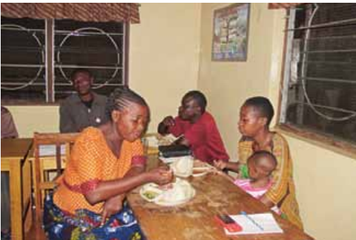
Workshop gegen häusliche Gewalt, Tansania.